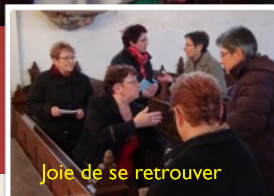
Joie de se retrouver