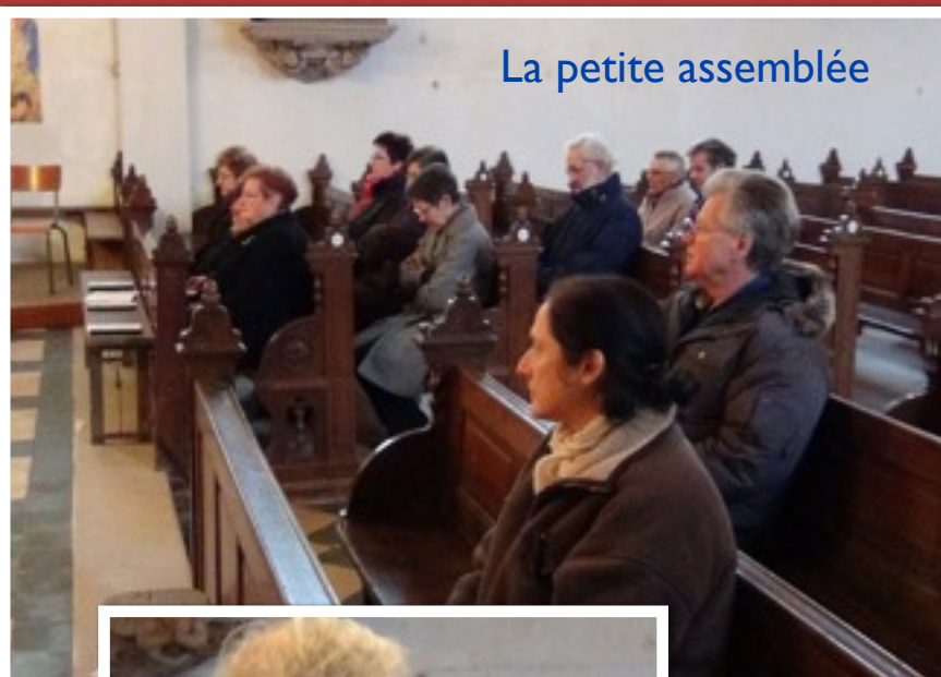
La petite assemblée