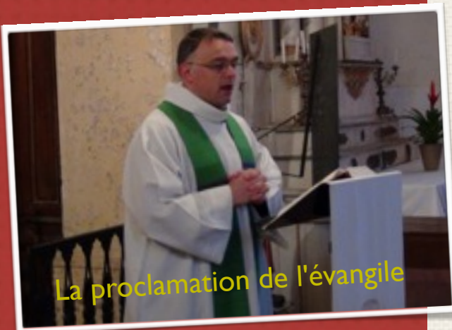
La proclamation de l'évangile

CHAQUE MATIN, LA MESSE EST CÉLÉBRÉE À 9H00 DANS LES DIFFÉRENTS VILLAGES DE LA PAROISSE DU CHRIST AUX LIENS. CELLE-CI EST PRÉCÉDÉE PAR L'OFFICE DES LAUDES À 8H45.