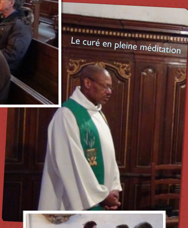
Le curé en pleine méditation